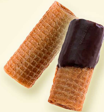
Waffelröllchen / Waffelröllchen halb ZB