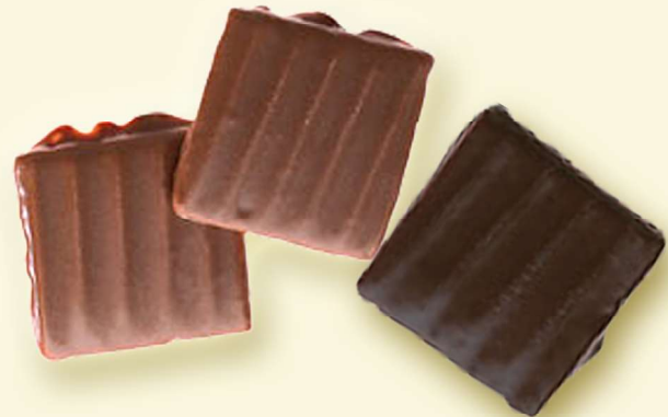
Waffelbätter VM / ZB