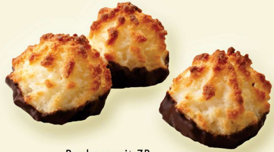
Rochers mit ZB weiches Kokosgebäck mit Zartbitterschokolade