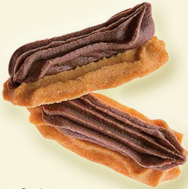
Creme-Spritz mit Kakaocreme-Auflage