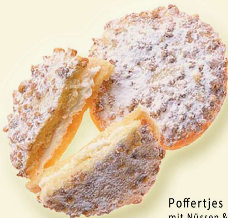
Poffertjes mit Nüssen & Puderzucker