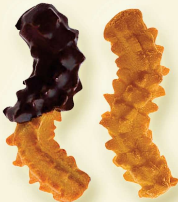
S-Butter-Spritz ZB / ohne