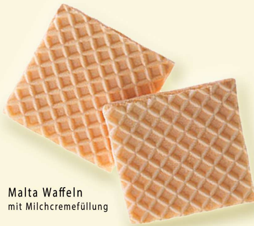
Malta Waffeln mit Milchcremefüllung