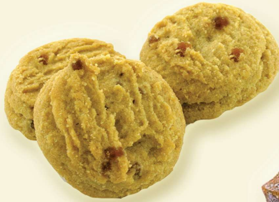
Apfel-Zimt-Gebäck mit Apfelstückchen