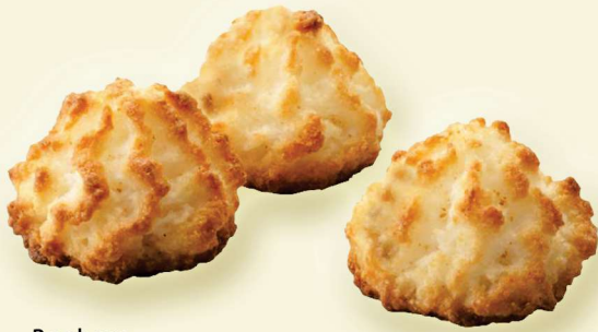
Rochers weiches Kokosgebäck