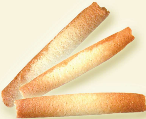
Golden Röllchen / Cigarettes Russes