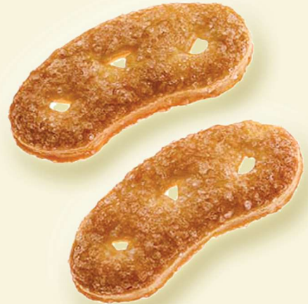
Krakelingen Blätterteig, gezuckert