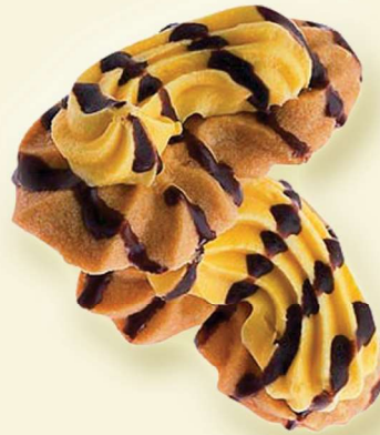
Hufeisen Spritzgebäck mit Advokatcreme-Auflage