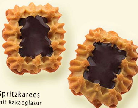
Spritzkarees mit Kakaoglasur