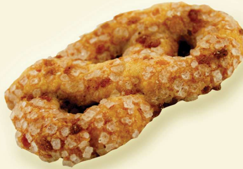
Butter-Brezeln mit Zimt