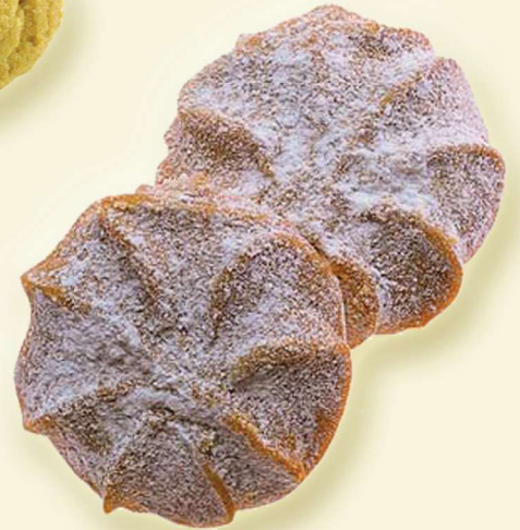
Schneespritz mit Puderzucker